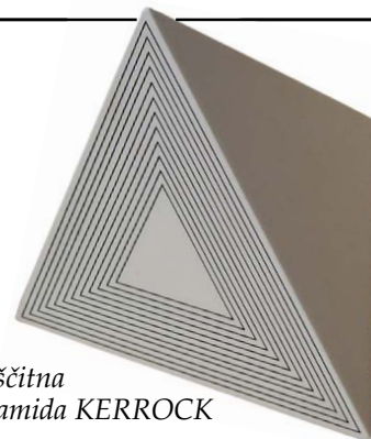
Zaščitna piramida KERROCK

poškodbe podzavesti, a je še nekaj skritega v podzavesti. Na ravni, na kateri se radiestezijsko ne da delovati. S posebno kodo lahko izbrskam nekaj, kar je bližje tega stanja in potem lahko pozdravim. Tistega, kar je skrito globoko, pa še ne morem.