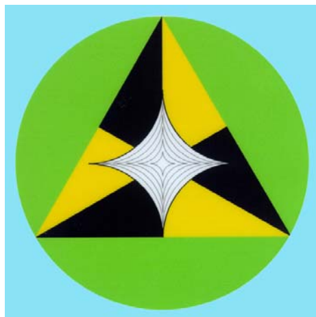
Zaščita pred entitetami