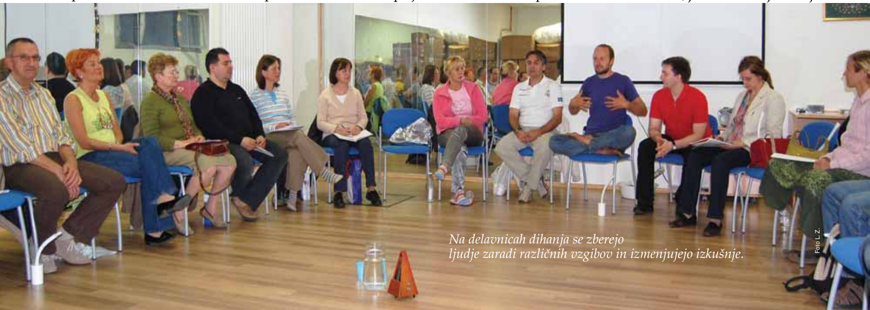
Na delavnicah dihanja se zberejo ljudje zaradi različnih vzgibov in izmenjujejo izkušnje.

Udeleženci so izmerili svoj začetni TAD (trajanje akta dihanja). Da določimo okvirni TAD, je treba vztrajati vsaj