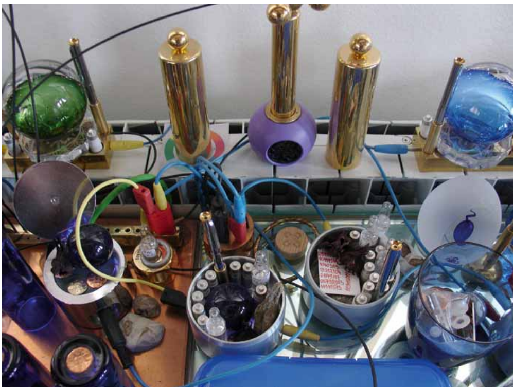
Del sistema za informiranje obeska Lučka

Obesek je oaza sveže, zdravilne, kozmične in zemeljske energije, v kateri lahko vedno znova obnavljamo lastno vitalnost, ustvarjalnost in dobro razpoloženje. Pod vplivom energij iz obeska se to dogaja na sproščen in nevsiljiv način. Deluje kot zdravilna, sprostitvena kopol.«