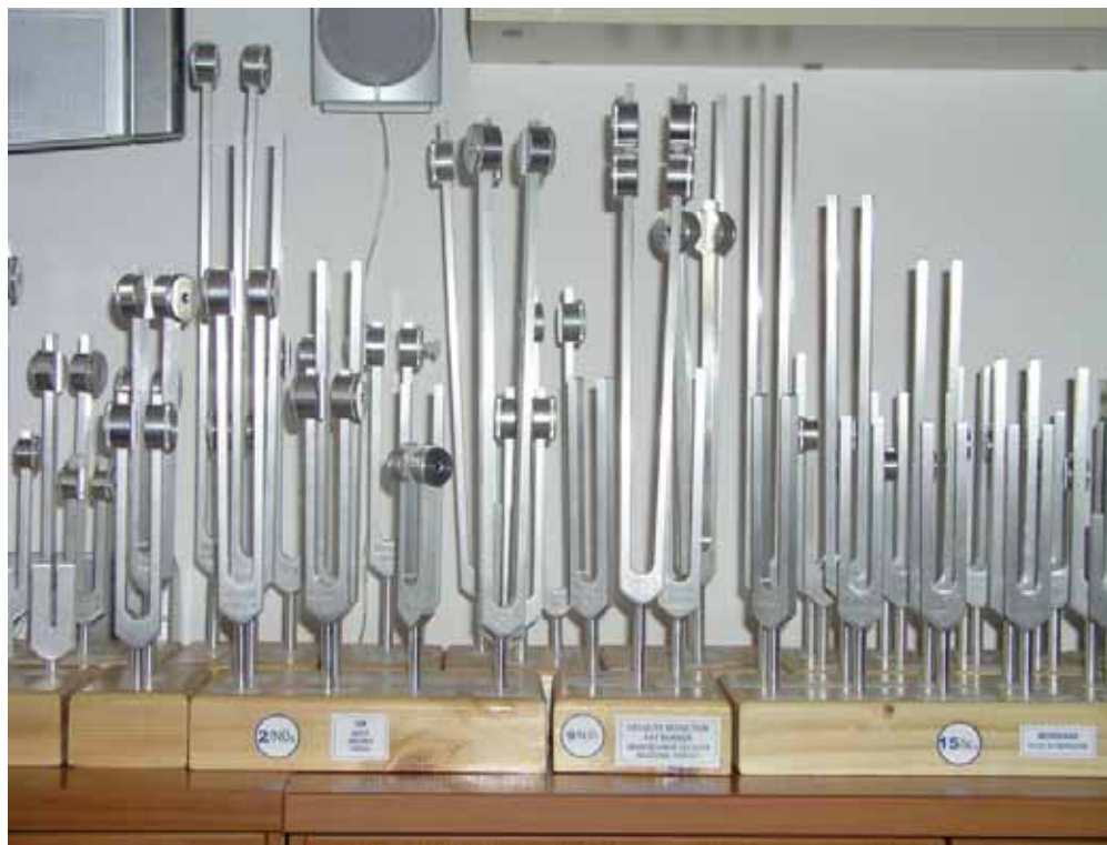
V zbirki Stanislava Besa so prav vse zvočne vilice, ki jih je mogoče dobiti za vse telesne, genske in duševne težave.

Spremembo energijskih polj opazimo, če zamenjamo nenaravno urbano okolje s hrupom, strupenim ozračjem, hitenjem in stresnimi razmerami za mirno, naravno in človeku prijazno okolje podeželja. Obdobje, v katerem prehajamo v sozvočje z vsem, kar zaznavamo, lahko traja več dni, spremlja pa ga kaotično stanje telesa in uma zaradi pre-