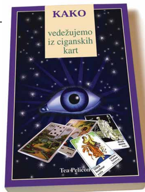
Knjiga Kako vedežujemo iz ciganskih kart je ravnokar izšla pri ARA založbi, naročite jo po telefonu: 01/549 17 92.

pa umaže, pokaže obremenitev tudi na fizični ravni. Se pravi, te spodnje čakre so še kar v redu. Ja, tukaj je problem, nekje v sredini, se pravi tale pleksus čakra je pri vas ... Mislim, da imate tudi ogromno opravka z ljudmi, da bi se morali v življenju čistiti ... Lahko so to strahovi, lahko so to zadeve, na primer, ko imate ogromno opravka z ljudmi, ki imajo različne interese od vas, in takrat, ko vi začutite, kar dobro čutite ... In tretje oko se je zaprlo. To je lahko zaradi izkušnje, ki se vam je zgodila, ne vem, nečesa nočete videti. A so tudi kakšne težave z očmi? Ne? Še kar vidite. Malo pazite na tretje oko ... Pri vas sta težava želodec in prebavni trakt, ki opozarjata, kadar nekaj energetsko ne »štima«. Kaj imate ...? Vas jezijo ljudje?