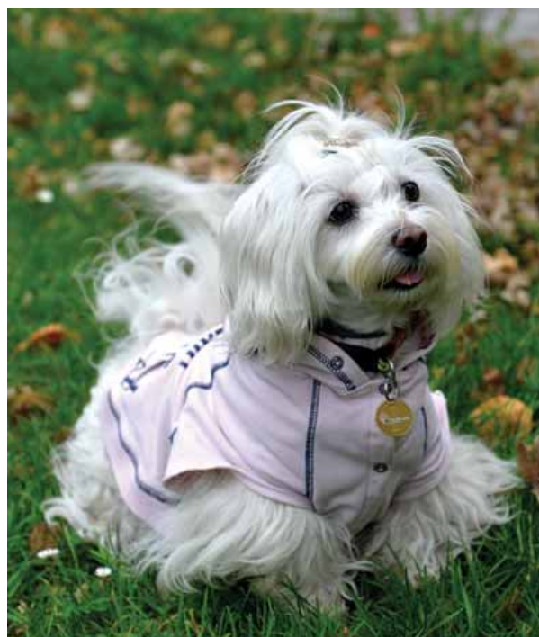
Nik ima zdaj mali polarix ves čas na ovratnici.

Nakup in informacije: Misteriji.si , 051/307 777