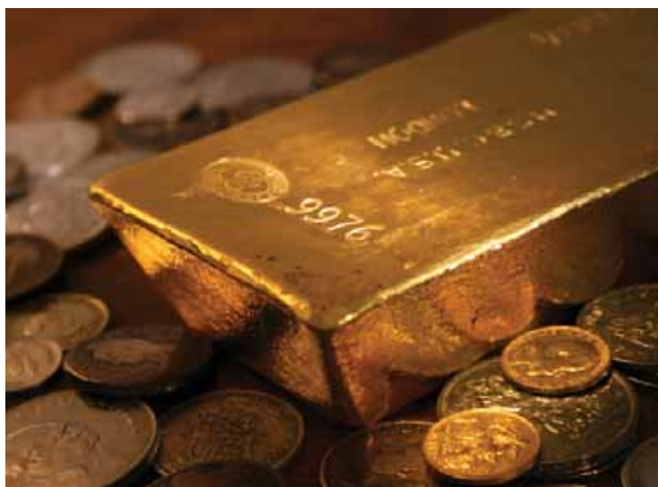
Zlato, simbol lepote in bogastva, hkrati predstavlja trajno vrednost, trajno svetovno valuto.

Cena zlata in ameriški državni dolgovi se v desetletjih od leta 1971 dalje dramatično vzpenjajo, vsako leto za 9 do 11 odstotkov. Pri razvijanju modelov je bilo očitno, da je letna stopnja rasti nacionalnega dolga zelo pomembna. Ko na podlagi ekspanzivne de-