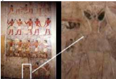
Spodaj: nenavaden piktogram iz egiptovske piramide.

Naslednja vprašanja razkrivajo, da se resnica o nezemeljskih obiskovalcih zelo nesporno prikriva.