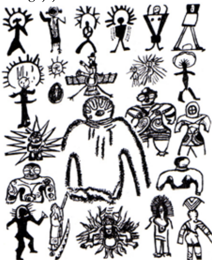
Zgoraj: zbirka tipičnih jamskih slikarij s prikazi starodavnih astronautov.

Naše pisanje najbrž ne bo niti pregnalo niti potrdilo sumov v obstoj nenavadnih plovil in njihovih humanoidnih posadk, bralca pa utegne vendarle prepričati, da se neke nenavadne stvari dejansko dogajajo.