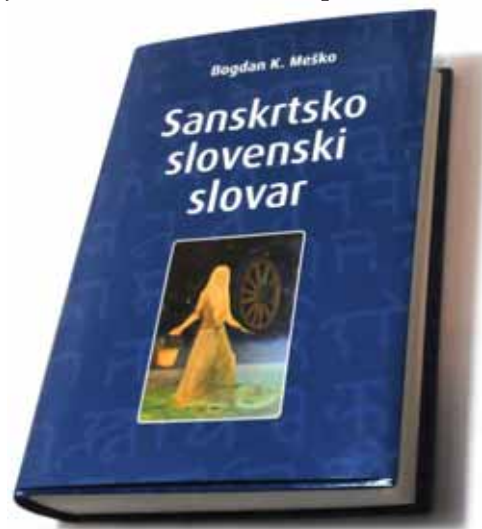
Slovar stane 135,00 € in ga lahko naročite na www.misteriji.si

Sanskrtska abeceda naj bi bila temelj vsega vesolja, v smislu, da je to organski jezik. Glas-črka A denimo pomeni veliko ,