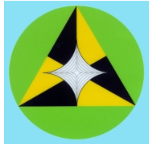
Univerzalna zaščita pred škodljivimi energijskimi entitetami.

»Morda gre pri tem za zelo hude oblike blodečih elementalov, ki jim sam pravim visoko inteligenčni elementali; ti so lahko zelo nevarni in jih je težko odpravljati. Zanimivi so tudi implantati kot tretja vrsta teh energij. To so vesoljska bitja, ki vdirajo v človekov ener-