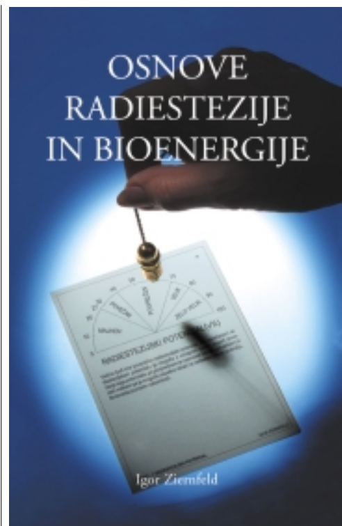
Priročnik za radiestezijsko in bioenergijo

kakšno anomalijo, jih vprašam, ali smem pomagati. To narekuje radiestezijska etika, ki prepoveduje, da bi radiestezijski kar koli delal na silo; smem opravljati le tiste storitve in meritve, za katere sem dobil dovoljenje.«