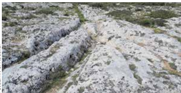
Okamenjene kolesnice vozil na Malti so stare vsaj deset milijonov let!

Na obstoj visoko razvite kulture homo sapiensa sapiensa kažejo tudi okamenjeni odtisi kolesnic očitno tehnološko zelo naprednih vozil na skrivnostni Malti. Tam je videti brezštevilne vsaj de-